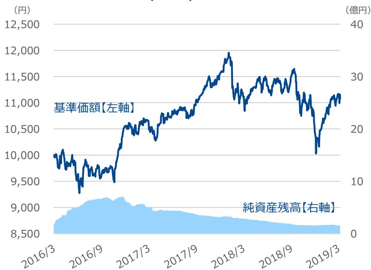
図表2 月末時点の基準価額